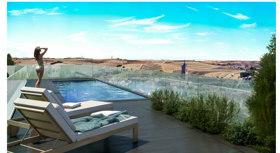
VIVIENDA 3D_1 2 Ud

NOTA: Plano orientativo, no constituye documento contractual, sujeto a modificaciones por exigencias técnicas, jurídicas o administrativas derivadas de la obtención de todos lo permisos y licencias reglamentarias, así como por necesidades constructivas o de diseño derivadas de la Dirección de Obra, sin que ello suponga merma de calidad. Las superficies tienen carácter provisional hasta la obtención de la correspondiente Licencia de Obras. La jardinería y el mobiliario tienen carácter meramente ornamental y, por tanto, no se entregan con la vivienda excepto cuando estén expresamente incluidos en la memoria de calidades. El mobiliario de cocina y la disposición de los electrodomésticos pueden sufrir variaciones en función de su montaje definitivo.